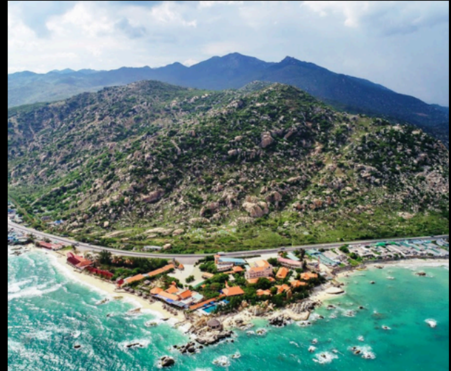
Hòn Cò Resort Cà Ná Ninh Thuận - Resort 3*