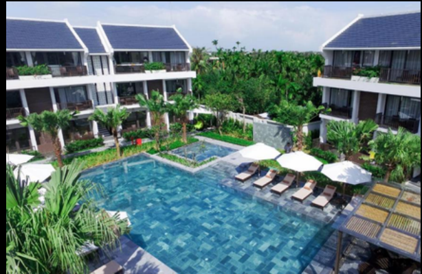
SENVILA BOUTIQUE RESORT Hội An Countryside - Khu nghỉ dưỡng 3*