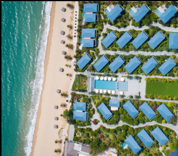
Hoàn Mỹ Resort Ninh Chữ Ninh Thuận - Resort tương đương 5*