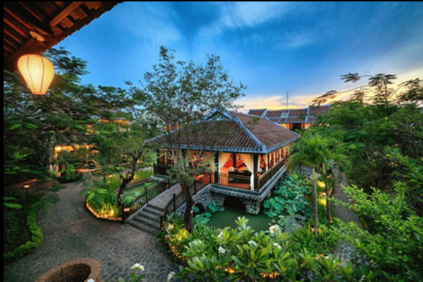
Silk Village Resort & Spa Hội An - Resort 4*